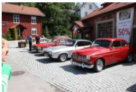
En fin dag for en hyggelig sammenkomst