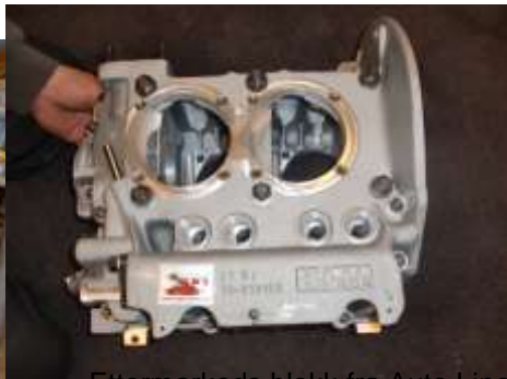
Ettenmarkeds blokk fra Auto Linea for 2,3 l. med blant annet forsterket gjenger til sylinder pinner.