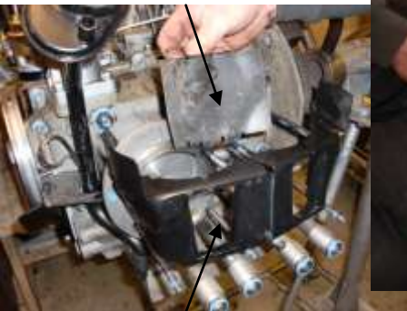
Kjøleblikk for racing type 3