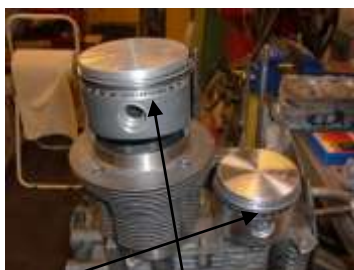
Originalt og racing stempel for modifisert 1915