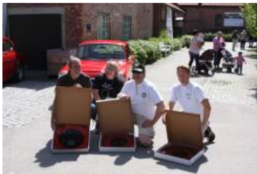
Representanter fra klubbene mottok gaver fra Hadeland glassverk