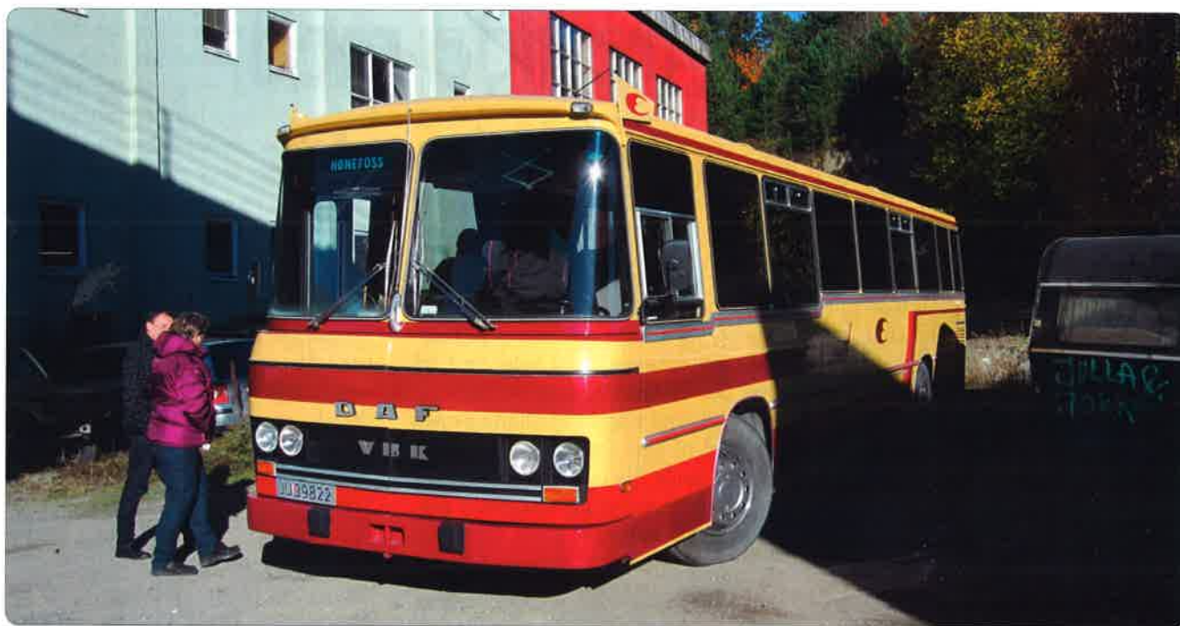
Denne VBK Engeseth bussen forvaltes nå av Ringerike og Omland Busshistoriske Forening (ROBF) Denne VBK Engeseth bussen forvaltes nå av Ringerike og Omland Busshistoriske Forening (ROBF)

streff i Hønefoss. Vi har stor tro på at arrangementskomiteen skal kunne greie å dra dette lasset vel i havn.