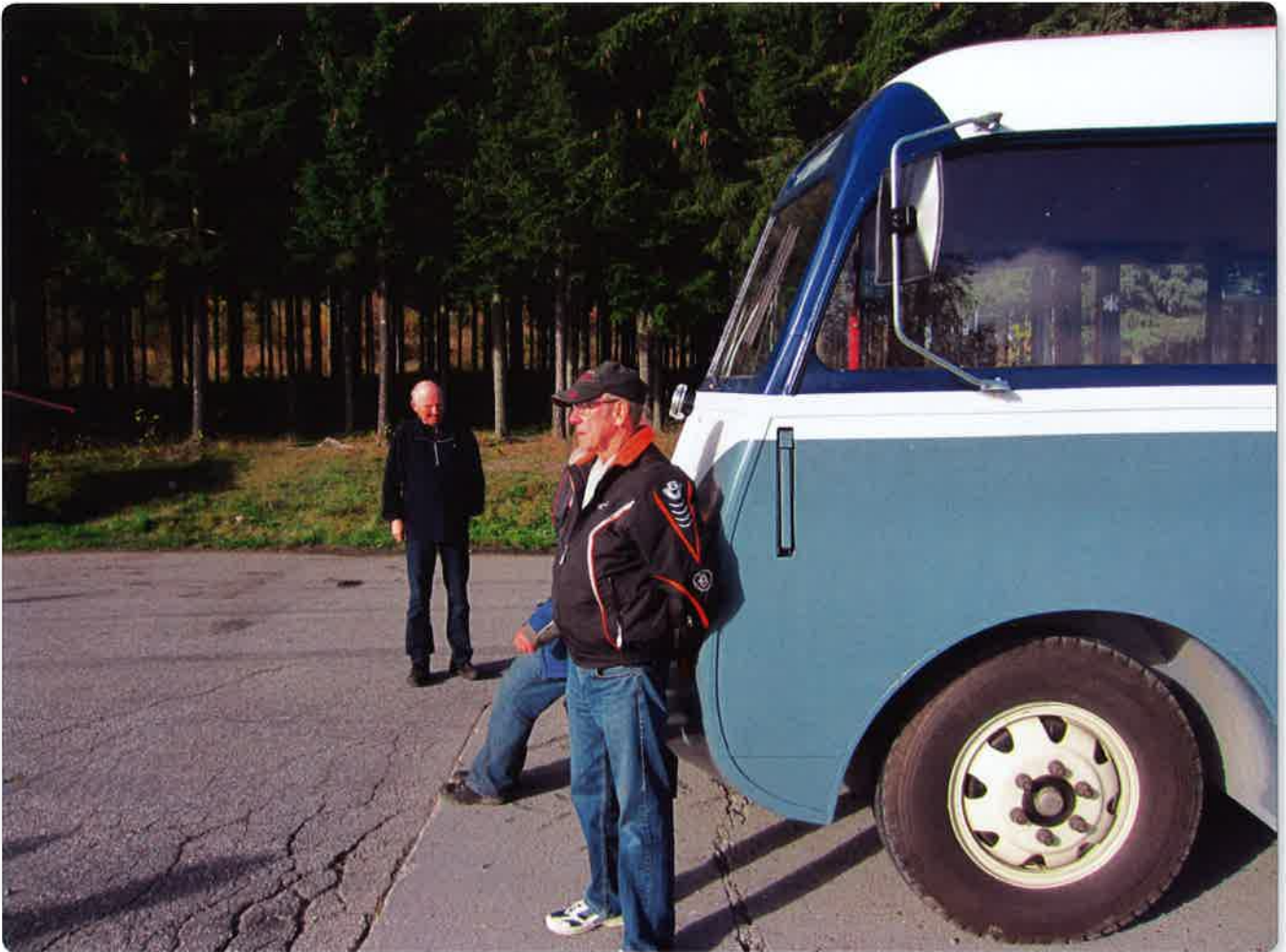
En pust i bakken for ringeriksbussen ved Tyristrand.

Det kan forsvares med at dette var en nybegynner i vårt miljø, det kan tenkes at de vil ha ønske om å bruke litt tid på forberedelsene, samtidig vi har ikke vært i disse trakter før med veteranbusstreff og RHF landsmøte. Det blir det 31. veteranbusstreff i RHF regi.