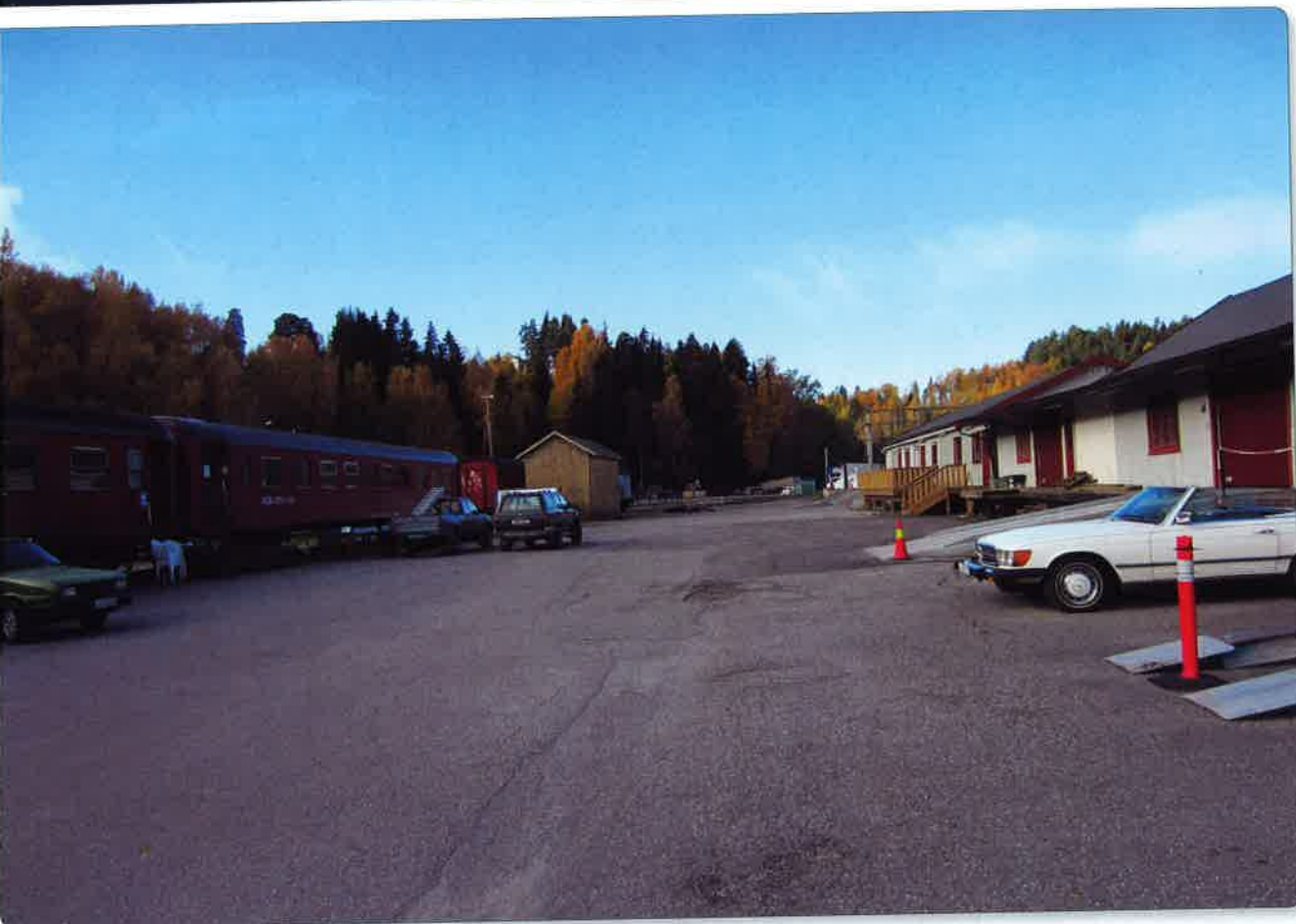
Treffområde ved Hønefoss i 2019.