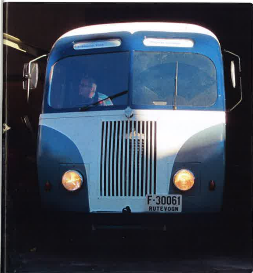
Den må lirkes ut av sitt gjemmested.